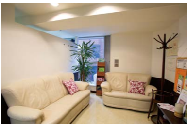
大通駅から徒歩の、仲通りにある。大人のサロンのような待合室