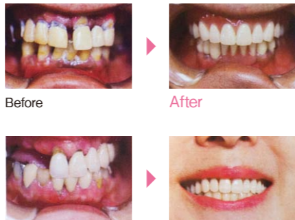
実際の症例。残せる歯と、抜歯しなければならない歯を選択し、力のバランスを考えて設計する

平成3年北海道大学歯学部卒業。札幌市内勤務医、分院長を経て23年開院。義歯に限らず、保険内・保険外の歯周病、審美など、歯科治療全般を行う