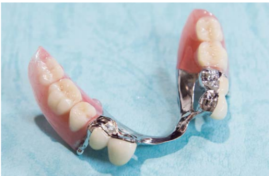
保険外のクラスプ(バネ)を極力目立たなく設計した部分義歯。精密で複雑な技工が施されている

しわが目立たなくなり、日常的な口角炎が治り、ふつくりした唇から美しい歯がのぞく。口を開けて笑うことに抵抗がなくなり、周囲からも「きれいな歯になった、若くなった」と言われることは自信を与え、健康にもつながります。しっかりと噛んで、素敵な笑顔になっていただくことは私の喜びでもあります。義歯も自身の歯同様メンテナンスが必要です。定期健診は必ず受けましょう。